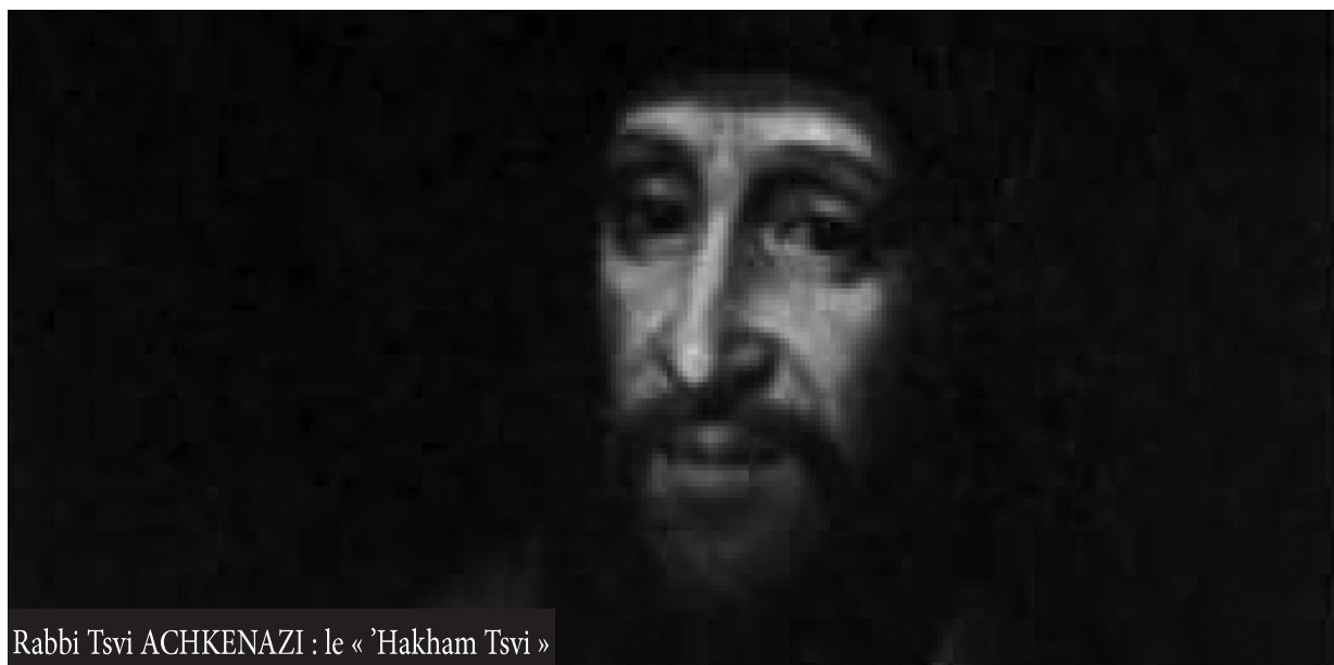
Rabbi Tsvi ACHKENAZI : le « 'Hakham Tsvi »