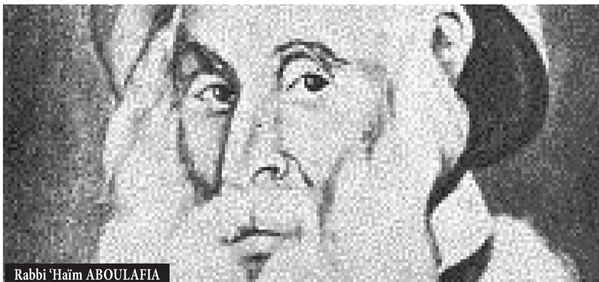
Rabbi Haïm ABOULAFIA