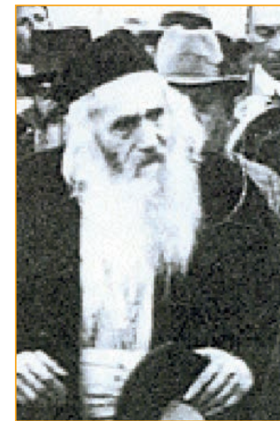
Rav Zonnenfeld, Grand-Rabbin de Jérusalem en 1910

Grâce au Kaddich que l'on récite pour moi à la Yéchiva, mes mérites m'ont enfin été comptés.