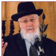
Rav Yossef-Haïm SITRUK