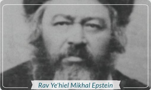
Rav Ye'hie'el Mikhal Epstein