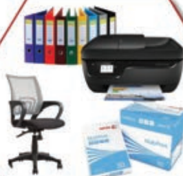
Fournitures de bureau

Recevez notre nouveau catalogue en ligne 054 66 726 44