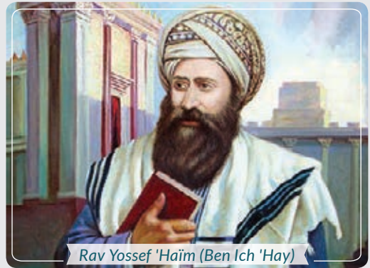
Rav Yossef 'Haïm (Ben Ich 'Hay)