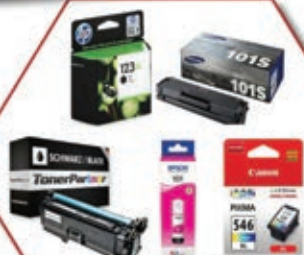
Cartouches Toutes références

Distributeur officiel Graffiti www.graf.co.il