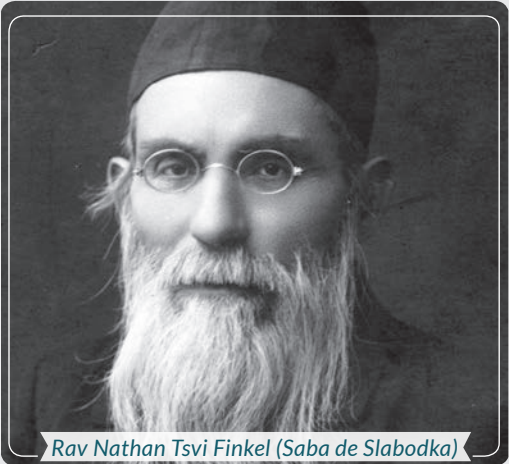
Rav Nathan Tsvi Finkel (Saba de Slabodka)