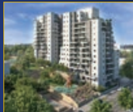
Sela Lavi Park , Newe Yaakov

3 Nouveaux projets à des prix attractifs.