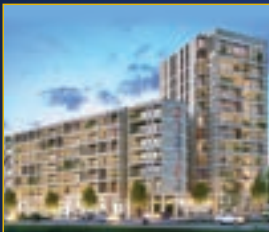
Leshem , Guilo

Quand vos rêves deviennent une réalité .