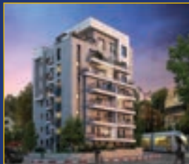
Hameiri , Kiryat Moshe