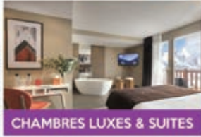
CHAMBRES LUXES & SUITES