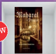
Maharal de Prague La vie de Rabbi Yehouda Loew