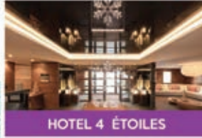
HOTEL 4 ÉTOILES