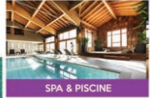
SPA & PISCINE