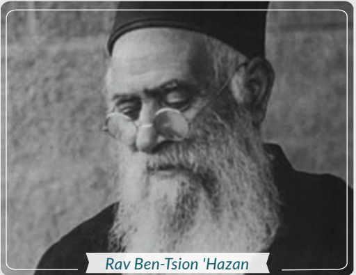
Rav Ben-Tsion 'Hazan

Dimanche 10 Novembre Rav Ben-Tsion 'Hazan Rav Yéhouda Tsadka Rav Yaakov 'Haïm Rav Zeev Wolf Kitsesses